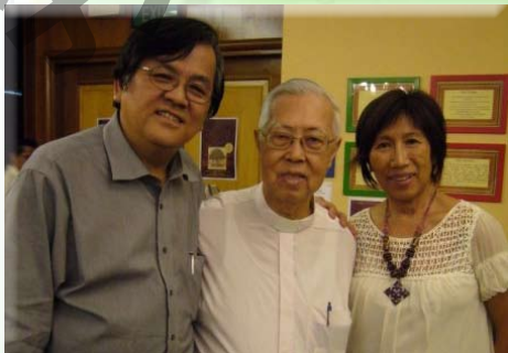
一般上，巴仙率是指我们能学存的。若作笔记，你能更明白和记忆更多。

教会的中心是福音。他们珍惜机构性教会的公开敬拜，和非正式性家庭聚会的灵恩式敬拜。这表示神的百姓从侍工和宣教中被装备起来。我们渴望盛港教会会成为一间被圣灵充满的教会。